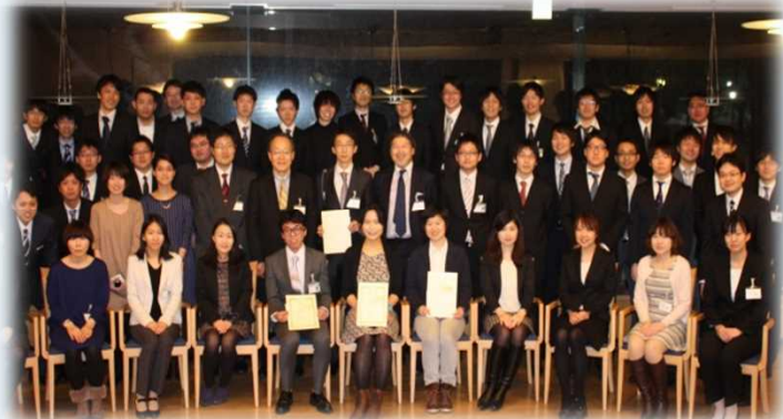
懇親会での集合写真