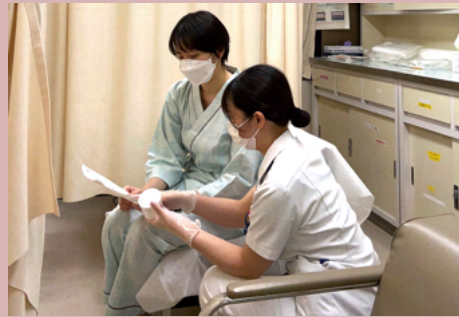
皮膚科皮膚 ケアの指導

4-2病棟は、皮膚科・形成外科・脳神経内科の混合病棟です。皮膚科では悪性腫瘍、薬疹、水疱症、アトピー性皮膚炎、形成外科では口唇口蓋裂、褥瘡、悪性腫瘍、脳神経内科ではALS、パーキンソン病などの患者さんがいます。患者層は乳児から高齢者と幅広く、周術期や化学療法・放射線治療などの急性期から、退院支援を含めた慢性期の看護を、多職種と連携しながら、患者と家族に寄り添う看護を提供しています。