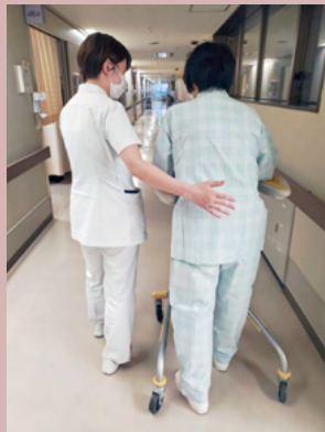
脳神経内科患者とリハビリ