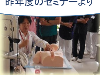
超音波ガイド下静脈穿刺