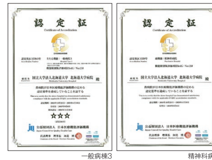
病院機能評価3rdG: Ver.2.0 認定

日本医療機能評価機構は、国民の健康と福祉の向上に寄与することを目的とし、中立的・科学的な第三者機関として医療の質の向上と信頼できる医療の確保に関する事業を行う公益財団法人であり、本院は、機構の定める基準に達しているとして、2019年9月6日付けで認定証の交付を受けました。