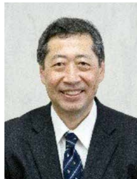
北海道大学病院長 Director of Hokkaido University Hospital