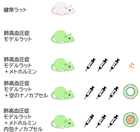
【図2】メトホルミン内包ナノカプセルを、肺高血圧症モデルラットへ投与しました。メトホルミン単独投与群、空のナノカプセル投与群も設定し、比較しました